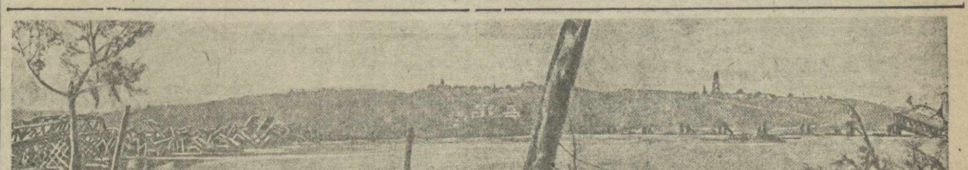
НА ДНЕПРЕ В РАЙОНЕ КИЕВА. Слева и справа — возводимые немцами мосты через реку. На правом берегу Днепра виден Киев и Киевско-Печерская лавра.

Крушение германского военного поезда в Норвегии