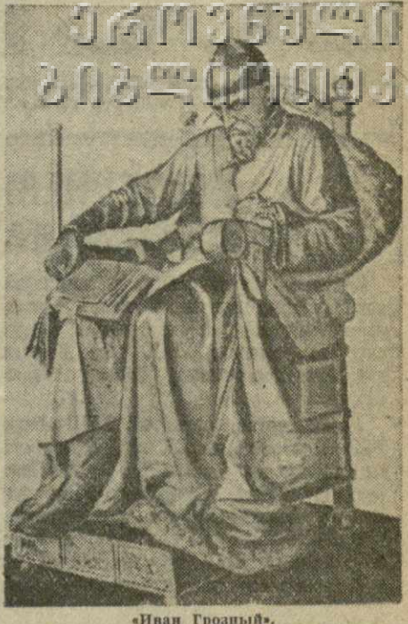
Иван Грозный. Работа скульптора М. М. Антокольского.

В истории развития русского изобразительного искусства имя Антокольского стоит в одном ряду с такими прославленными именами, как Крамской, Репин, Суриков. Вместе с этими первыми деятелями русской культуры Антокольский изучал науку и искусство в Академии художеств, вместе с ними воспринимал демократические идеи эпохи, боролся за утверждение полнокровного идейного реалистического искусства.