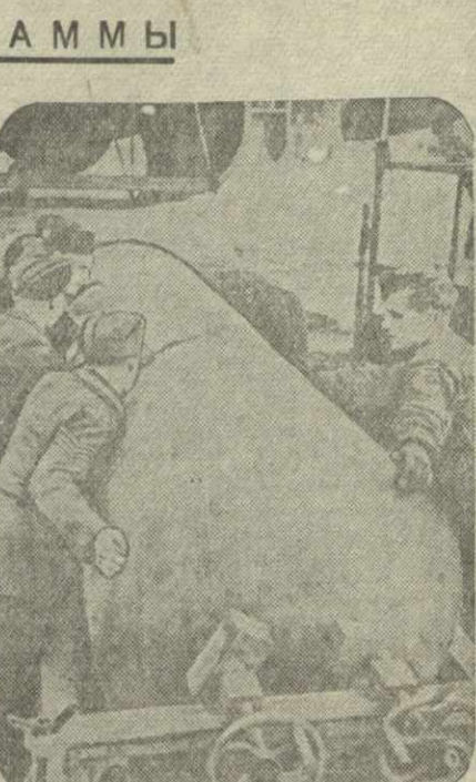
Действия авиации союзников. На снимке полковник авиации бомбардировщик перед вылетом на бомбардировку неприятельских объектов в Европе.

О РАБОТЕ КОНСУЛЬТАТИВНОГО СОВЕТА ПО ВОПРОСАМ ИТАЛИИ