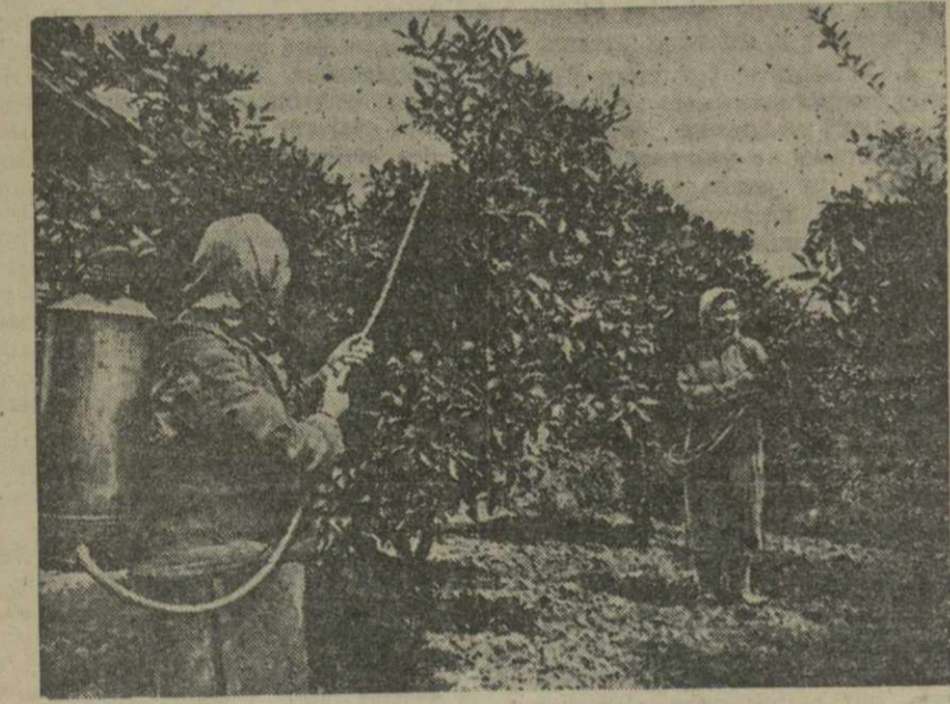
Лечение лимонных деревьев в Чанвинском совхозе имени Ленина.