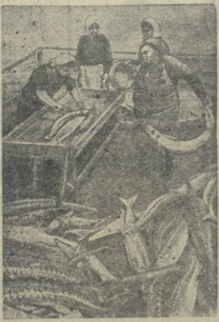
Астраханский ироно-балычный завод. На снимке: приемка и резка красной рыбы.