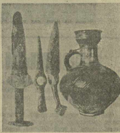
Образцы железного оружия и глиняный кубок из дванских погребений.

Селение Двани расположено в ущелье реки Проне (Карельский район). В 1945 году в этой местности, называемой Солоперда, Горьковский историко-этнографический музей произвел археологические раскопки небольшой холма, западная сторона которого спускается в ущелье р. Проне. Здесь проходит Карело-Дванская Коринская шоссеяная дорога, при проведении которой еще в 1940 году рабочими было обнаружено несколько погребений.