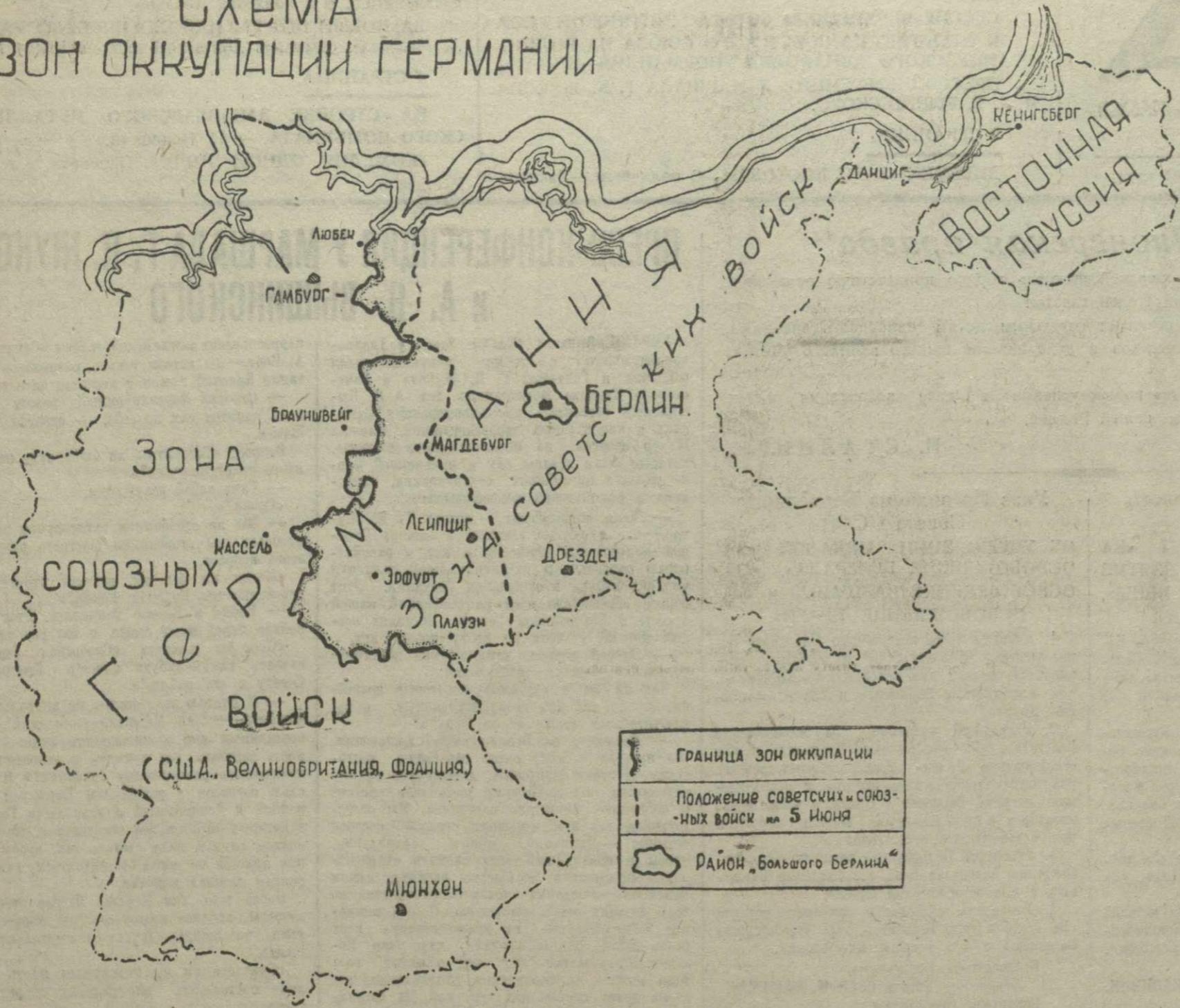
Схема зон оккупации Германии