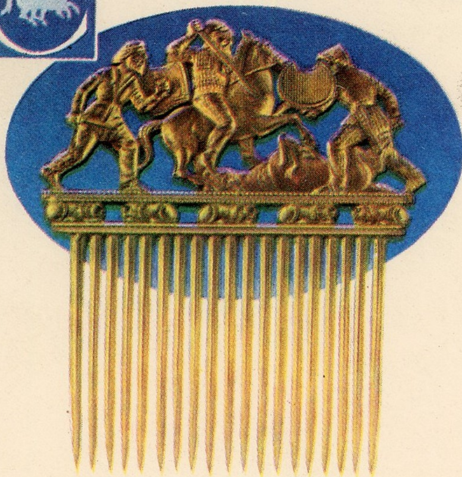
Гребень (золото). IV век до н. э.

Государственный Эрмитаж ОКРОВИЩА СКИФСКИХ КУРГАНОВ