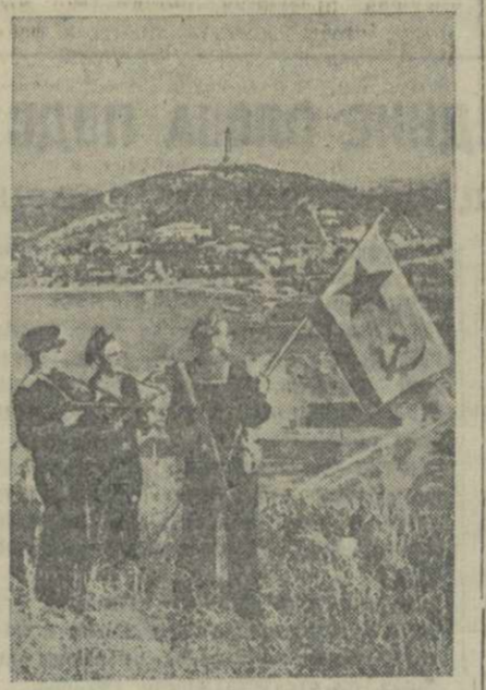
Морские десантники Тихоокеанского флота водружают флаг Военно-Морского флота СССР над бухтой Порт-Артура. (Снимок сделан 23 августа 1945 г.).

под контроль. Тот факт, что эти страны не имеют значения, не имеет значения. Нормально по дипломатии создаются в Японии и Греции и Албании, но может не отразиться на других районах и на общей политической обстановке. Необходимо помнить об этом в настоящее время, когда союзники пытаются покончить с войной и установить мир. Существует опасность серьезных осложнений не только местного характера. Опасное положение, создавшееся между Грецией и Албанией, может прежде всего отразиться на Балканах, а затем на общей политической обстановке, а может быть, и не только на политической обстановке. Совет должен руководствоваться не учетом того, затронут ли интерес какой-либо из членов Совета, а стремлением поддерживать международный мир и безопасность. Некоторые члены Совета руководствуются не этим высшим соображением, а некоторыми другими соображениями.