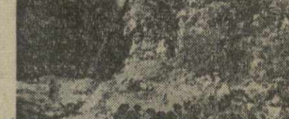
Мост в Тбилиском ботаническом саду.

Завершен капитальный ремонт продукто-промтоварного магазина № 2 Тбилисского района на Вокзальной улице.