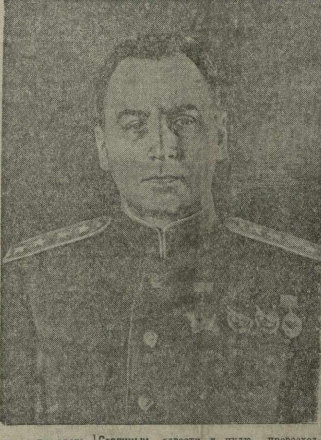
Товарищ Антонов А. И., Начальник Генерального Штаба Красной Армии.

Почему многие демобилизуемые из Красной Армии находят свой хозяйственный поприще для разоренных. Местные органы власти и колхозы проектом Закона обязываются помогать демобилизуемым в их устройстве. Проект Закона предусматривает также предоставление работы демобилизуемым не позднее месячного срока со дня прибытия их к месту жительства.