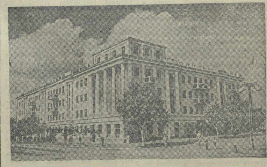
Донбасс. Восстановленный жилой дом рабочих и инженерно-технических работников Максеевского коксохимического завода.

ПОЛОЖЕНИЕ В КОРЕЕ БРАЗЗАВИЛЛЬ, 6 октября. (ТАСС). Браззавильское радио передает сообщение американского радио, исходящее из Сеула (Корея), согласно которому американские власти объявили в своей зоне военного положения.