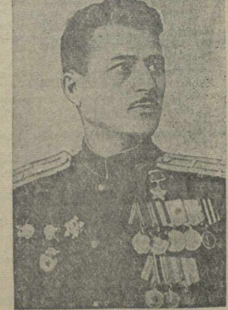
Герой Советского Союза А. Н. Букия — в Тбилиси

В Тбилиси побывал Герой Советского Союза танкист — подполковник Акакий Константинович Букия.