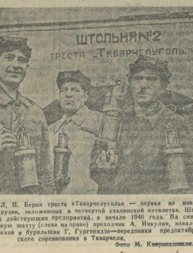
Штольня № 2 треста «Ткварчелуголь»