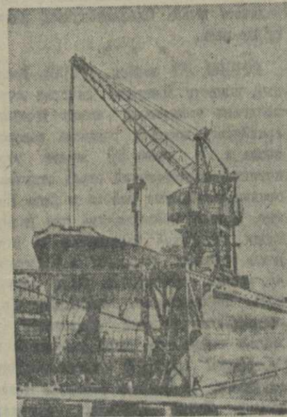
Досрочно отремонтированный и спущенный на воду паролод на судовой в Петропавловске-на-Камчатке.

Для снабжения сырьем фабрики первой очереди трестом будут разрабатываться новые поля Шукрутского на-