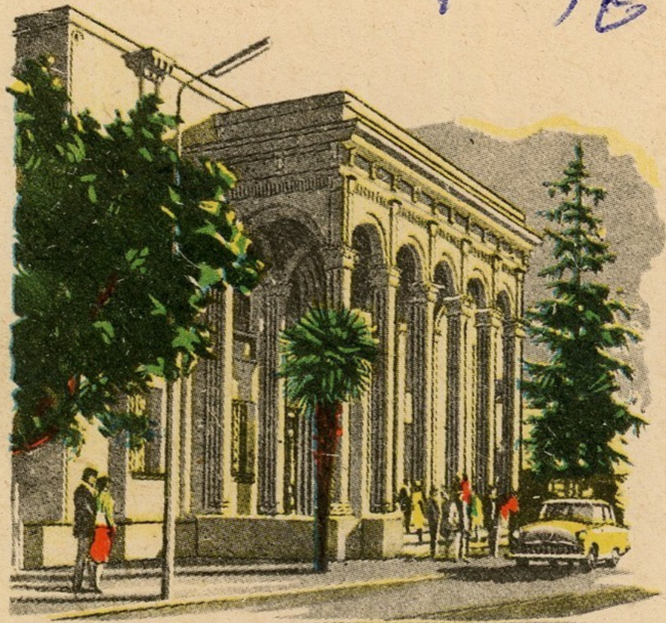
Грузинская ССР. Зугдиди. Государственный драматический театр им. Ш. Дадияни

საპოსტო ქვეყნის სახელი და სახელმწიფო დრამატული თეატრი ფ. დადიანის სახელობის სახელმწიფო დრამატული თეატრი