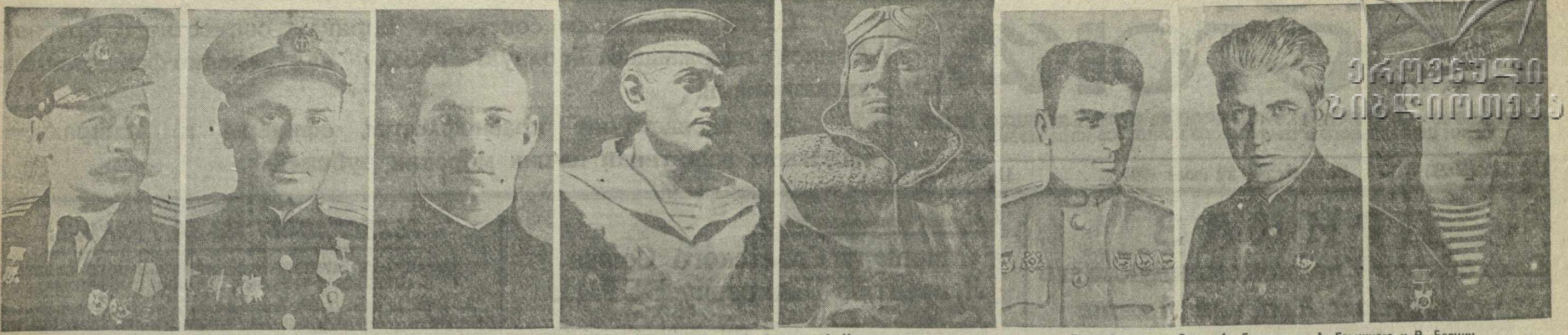
Герои Советского Союза Я. Иоселиани, А. Каналадзе и К. Кочиев.