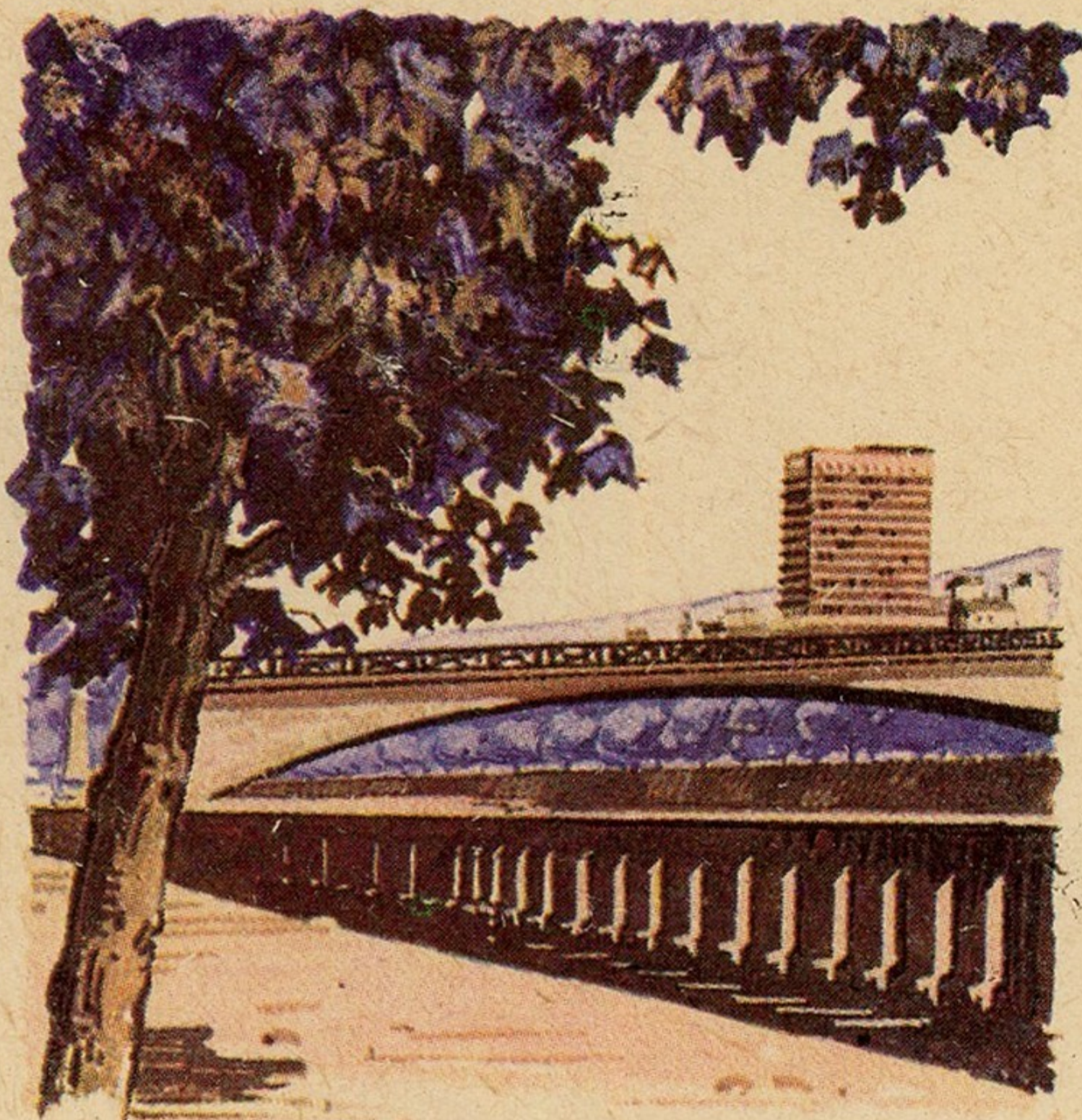
ТБИЛИСИ. ГОСТИНИЦА „ИВЕРИЯ“