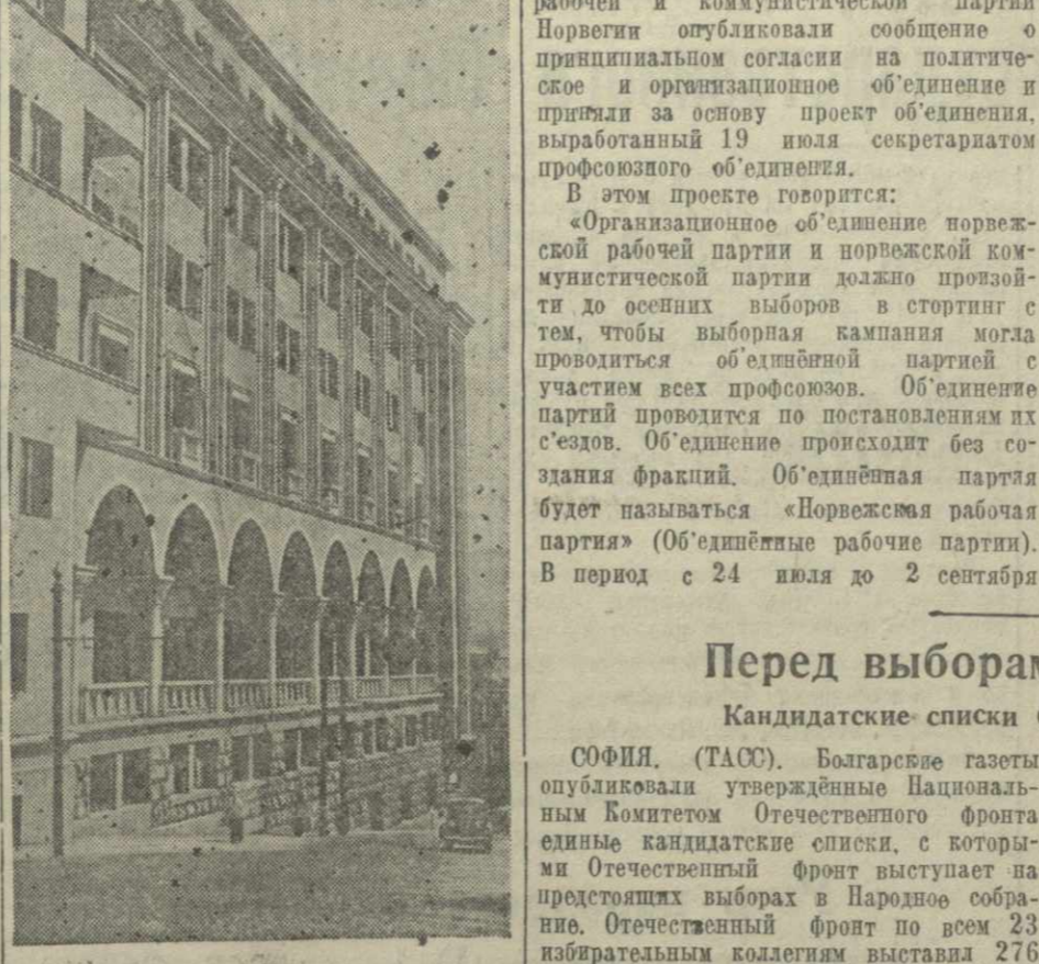
Тбилиси. Дом правительства Грузинской ССР (бювова фасада).