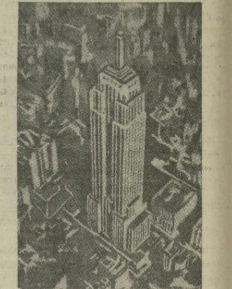
На снимке: здание «Эмпайр стейт билдинг» в Нью-Йорке.

Как передавало нью-йоркское радио, часть самолёта обрушилась на крышу соседнего здания, вызвав пожар, другая часть врезалась в стену небоскреба, разбрасывая струи пламени. Нью-Йорк, подчеркнул диктор, ещё не видел такого большого пожара.