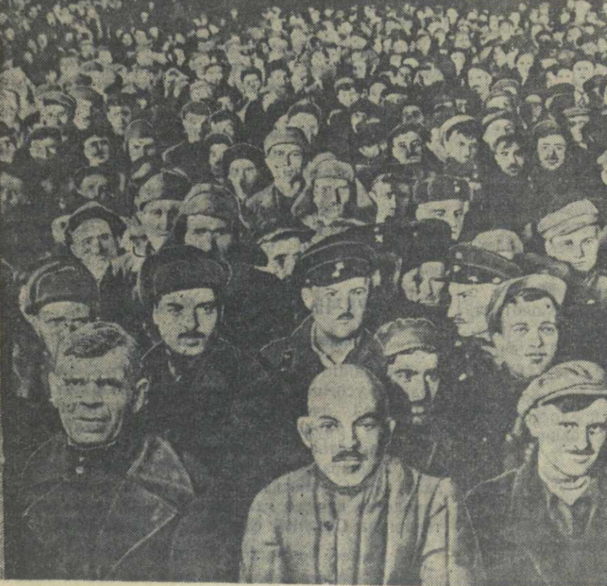
На предвыборном собрании рабочих и служащих Тбилисского паровозо-вагоноремонтного завода имени Сталина в связи с выдвижением кандидатуры в депутаты Верховного Совета Грузинской ССР.

2. Просить товарища И. В. СТАЛИНА дать свое согласие баллотироваться в депутаты Верховного Совета РСФСР по Сталинскому избирательному округу гор. Москвы от рабочих, служащих, инженеров и техников Московского электроразвода.