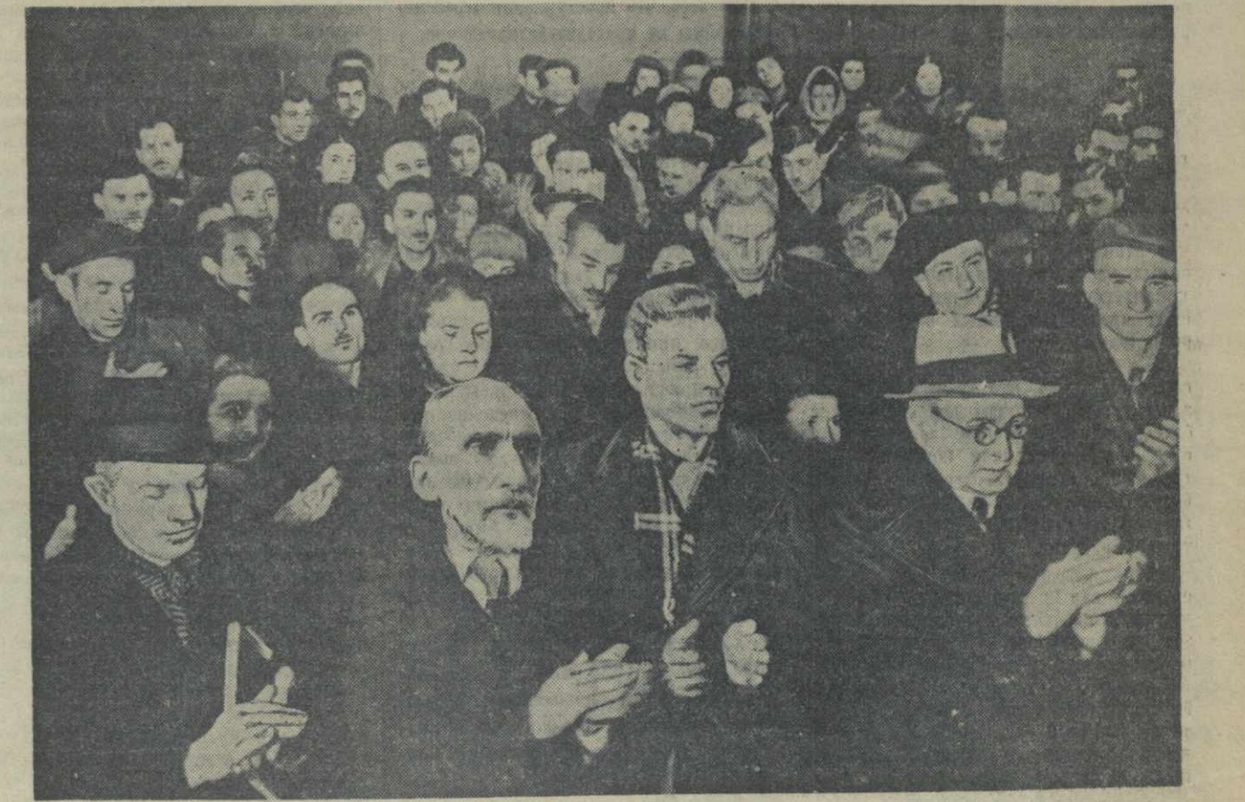
Предвыборное собрание в Академии художеств Грузии.

Затем собрание избрало делегацию на окружное предвыборное совещание в составе 37 человек.