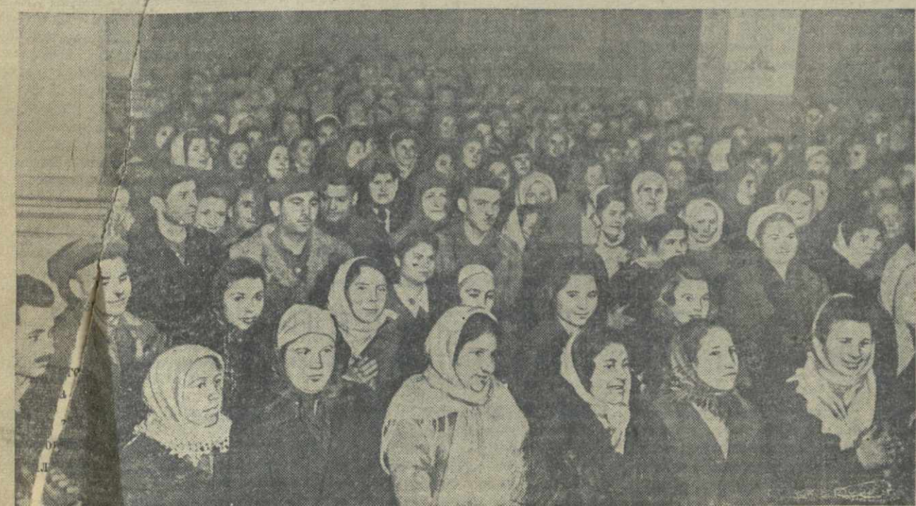
На собрании рабочих и служащих Тбилисской обувной фабрики им. Берия в связи с выдвижением кандидатов в депутаты Верховного Совета Грузинской ССР.