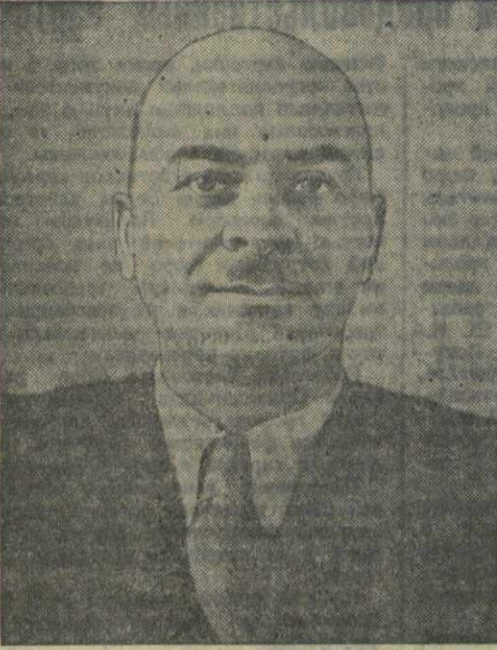
Илья Никифорович Лагидзе