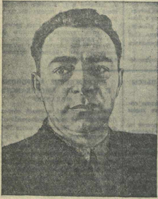
Александр Илларионович Джанелидзе