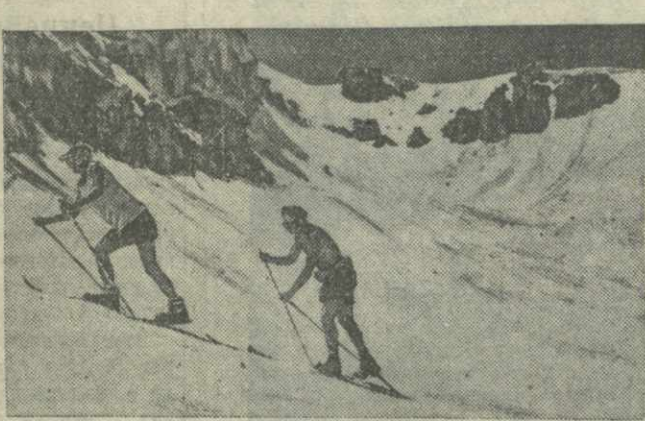
Лыжники на Казбеге.

Недавно на Казбеге, после окончания тренировочного сбора сильнейших лыжников, были проведены итоговые соревнования по высокогорному скоростному спуску на лыжах и слалому.