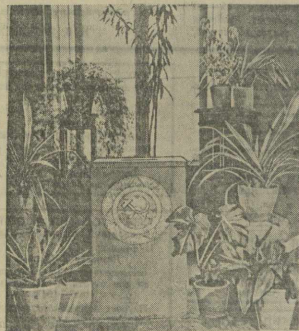
На избирательных участках Тбилиси. Слева — урна для бюллетеней на участке № 2 Джержинского избирательного округа; справа — кабинеты для голосования на участке № 2 Берия — избирательного округа.

В селении Меджикне-Пхали годовой доход каждой колхозной семьи сейчас в несколько раз превышает годовой доход всего колхоза в первые годы его организации. Особенно высокие доходы семей Османа Дасаидзе, Юсуфа Гогидзе, Адема Какабадзе, Джамала Бо-