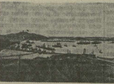
На рейде Порт-Артура. Со снимка времен русско-японской войны 1904—1905 гг.