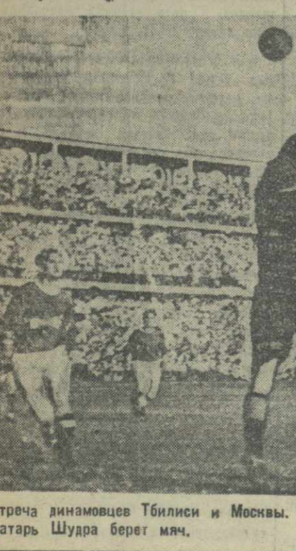
Встреча динамовцев Тбилиси и Москвы. На снимке: момент игры у ворот Тбилиси. Вратарь Шудра берет мяч.