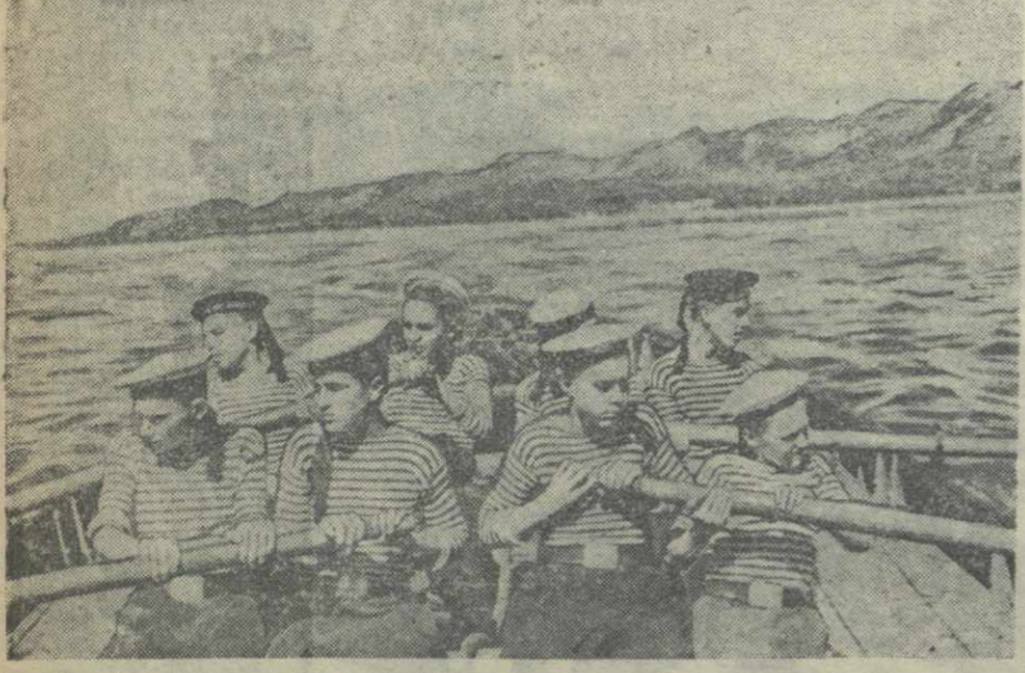
Батумская школа юнгов. На гребле.

(По телефону и телеграфу от наших корреспондентов)