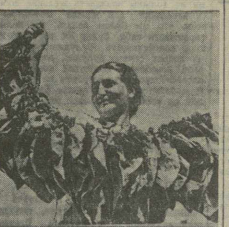
В колхозе имени Тельмана сел. Шрома Лагодского района идет работа по табаку нового урожая.

СУХУМИ. (По телефону от наш. спец. корр.). Сухумский ферментационный завод первым в Абхазии начал новый производственный сезон. Ремонт завода закончен на полтора месяца раньше срока и проведен добросовестно. Отремонтированы электродвигатели, установлены котлы, почти полностью заменена паропроводная сеть. На днях были загружены табакочными камерами ферментационные камеры. В процессе ферментации сейчас находится 60 тонн табака нового урожая.