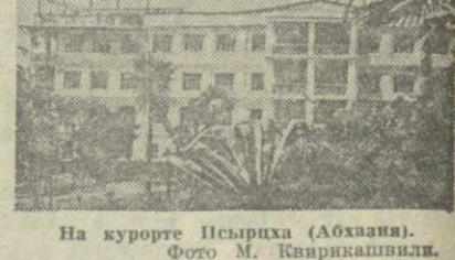
На курорте Псырха (Абхазия).