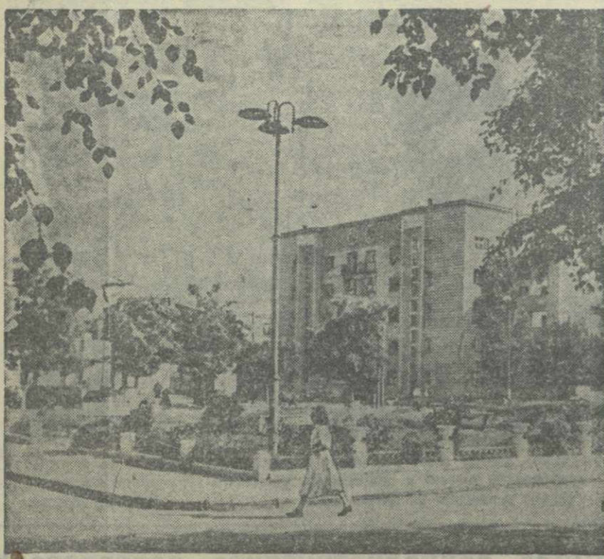
Днепрострой. Одна из улиц 6-го посёлка.