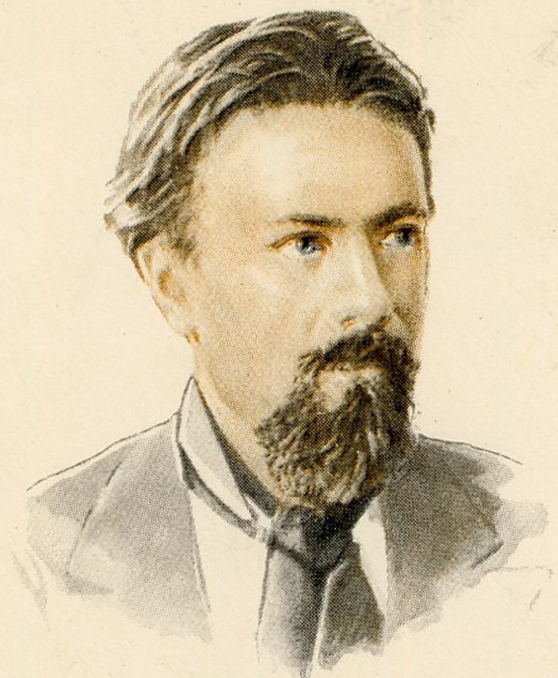
Русский революционер, народоволец, изобретатель Н. И. Кибальчич 1853—1881

Куда Երևան Մրճակ 68 Երևանի տնտեսագիտական Կոմ ստորագրության բաժնի ԽՍՀՄ-ՁԵ Գրասենյակ