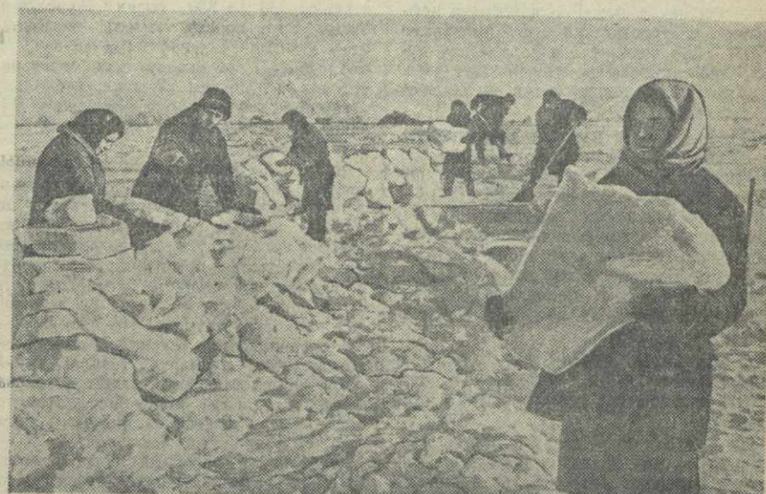
Колхоз «Новая жизнь» Новосибирского района в прошлом году досрочно выполнил все обязательства перед государством и сдал сверх плана 77 тонн хлеба.