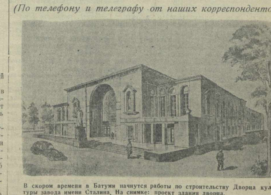
В скором времени в Батуми начнутся работы по строительству Дворца культуры завода имени Сталина. На снимке: проект здания Дворца.

(По телефону и телеграфу от наших корреспондентов)