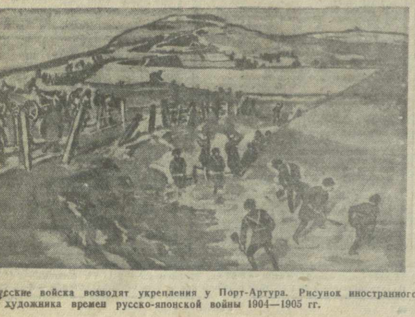
Русские войска возводят укрепления у Порт-Артура. Рисунок иностранного художника времен русско-японской войны 1904—1905 гг.

Отметив 10-ю годовщину стахановского движения — высокими производственными показателями, коллектив шахты обязался в сентябре закрепить эти успехи, достойно подготовиться к XXVIII годовщине Великого Октября.