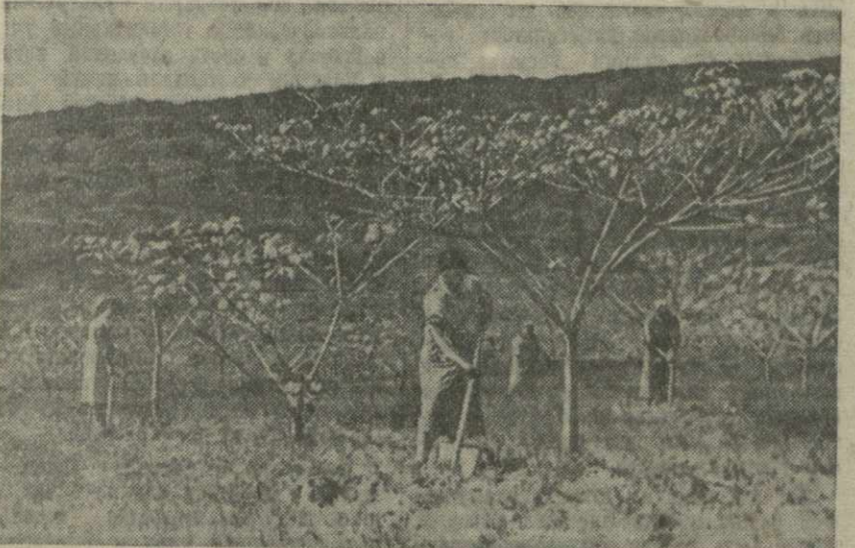
Плантация тунга в совхозе «Энергия» Сухумского района. Коллектив совхоза, напряженно трудясь, стремится дать советской родине больше ценных тутовых плодов.