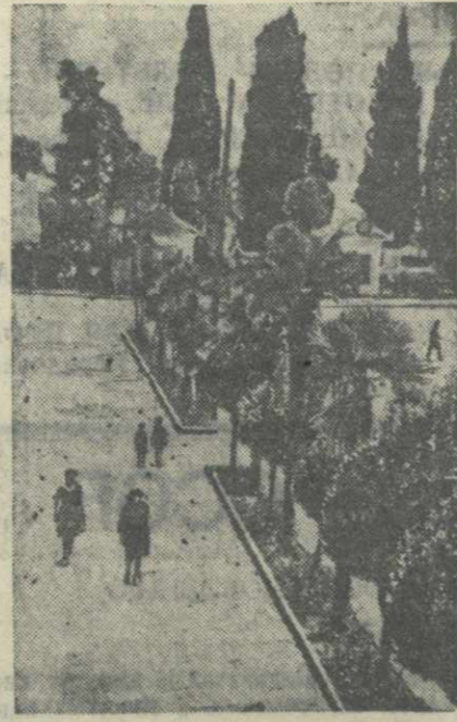
Сухуми. Улица имени Ленина.

Но как бы ни был труден предостроительный путь нашего строительства, он все же во много раз легче, чем четырёхлетняя война. И можно не сомневаться, что народы Советского Союза сумеют в наступающую пятилетку не только залечить раны, нанесённые войной, но и достигнуть более высокого материального положения, чем оно было до войны.