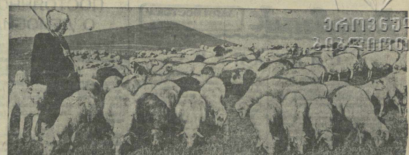
Отара овец колхоза им. Шаумяна села Ороджолар Богдановского района на летнем пастбище.