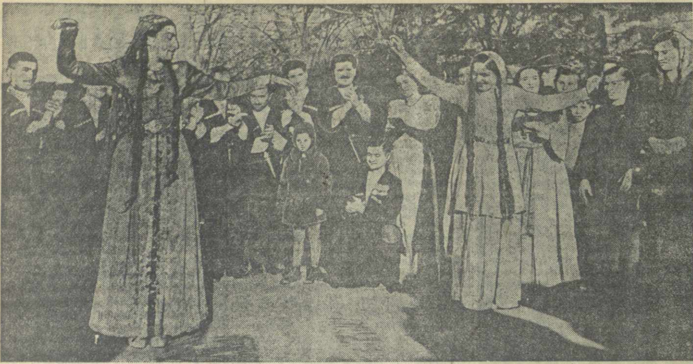
Выступление самодеятельных коллективов у избирательного участка № 27 Ленинского района в день выборов.