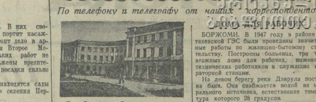
Гор. Сталинири, Здание гостиницы.