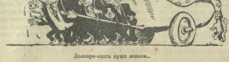
Рис. И. Гурро.

В статье о перспективах Англии на 1948 год «Дейли уоркер» пишет, что это будет самый мрачный год, ибо, если только не произойдет радикального изменения политики правительства, Англия подпадет под власть Соединенных Штатов, инфляция еще более усилится и вызовет дальнейшее повышение цен вместе с увеличением безработицы. Все это тяжело отразится на жизненном уровне английского народа. Но шутливым «благодетельством» проникновенно и в область идеологии. На запрос члена парламента, почему восемьдесят процентов выходящей в Англии беллетристики — американского происхождения, секретарь министерства финансов Холл разъяснил, что