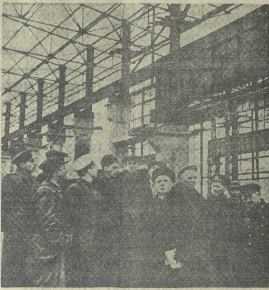
Группа делегатов IV Всесоюзной конференции по бетону и железобетонным конструкциям осматривает строящийся мартовский цех Закавказского металлургического завода. Фото В. Тархова.

Серебряная ваза, изготовленная в честь 30-летия Октября, по указанию товарища Сталина передается в Третьяковскую галерею, новогодний подарок латышского народа — фотоальбом передается в Музей революции СССР. (ТАСС).