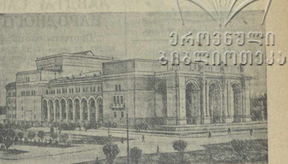
Здание театра оперы и балета в Ташкенте, построенное по проекту академика А. В. Щусева.

Завод строится в западной части города, вблизи железнодорожной станции и холодильника.