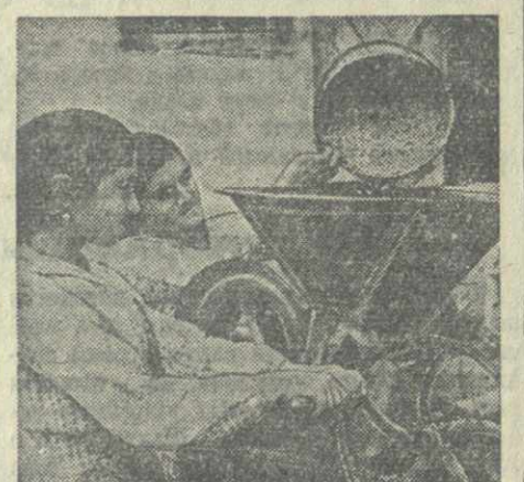
Очистка семян в колхозе «Красное знамя» селения Самшило Тетричкларского района.

Редакция Блазурской районной газеты «Галтиади» организовала рейд по проверке работы торговых организаций города. Участники рейда—работники газеты проверили магазины, столовые, ларьки города и выявили серьезные недостатки в работе торговых организаций.