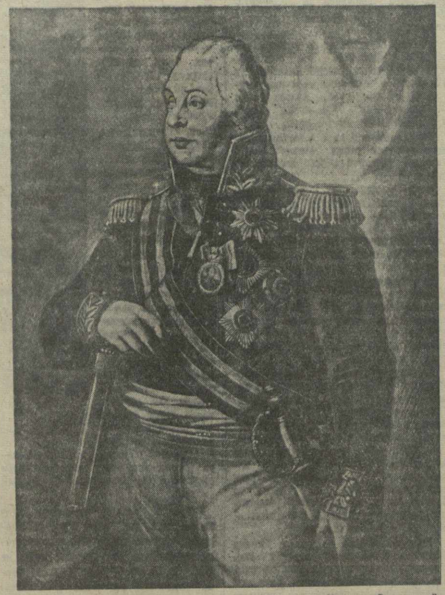
Генерал-фельдмаршал Михаил Илларионович Голицын-Кутузов Смоленский. Картина художника Р. Волкова. (Посударственная Третьяковская галерея.)