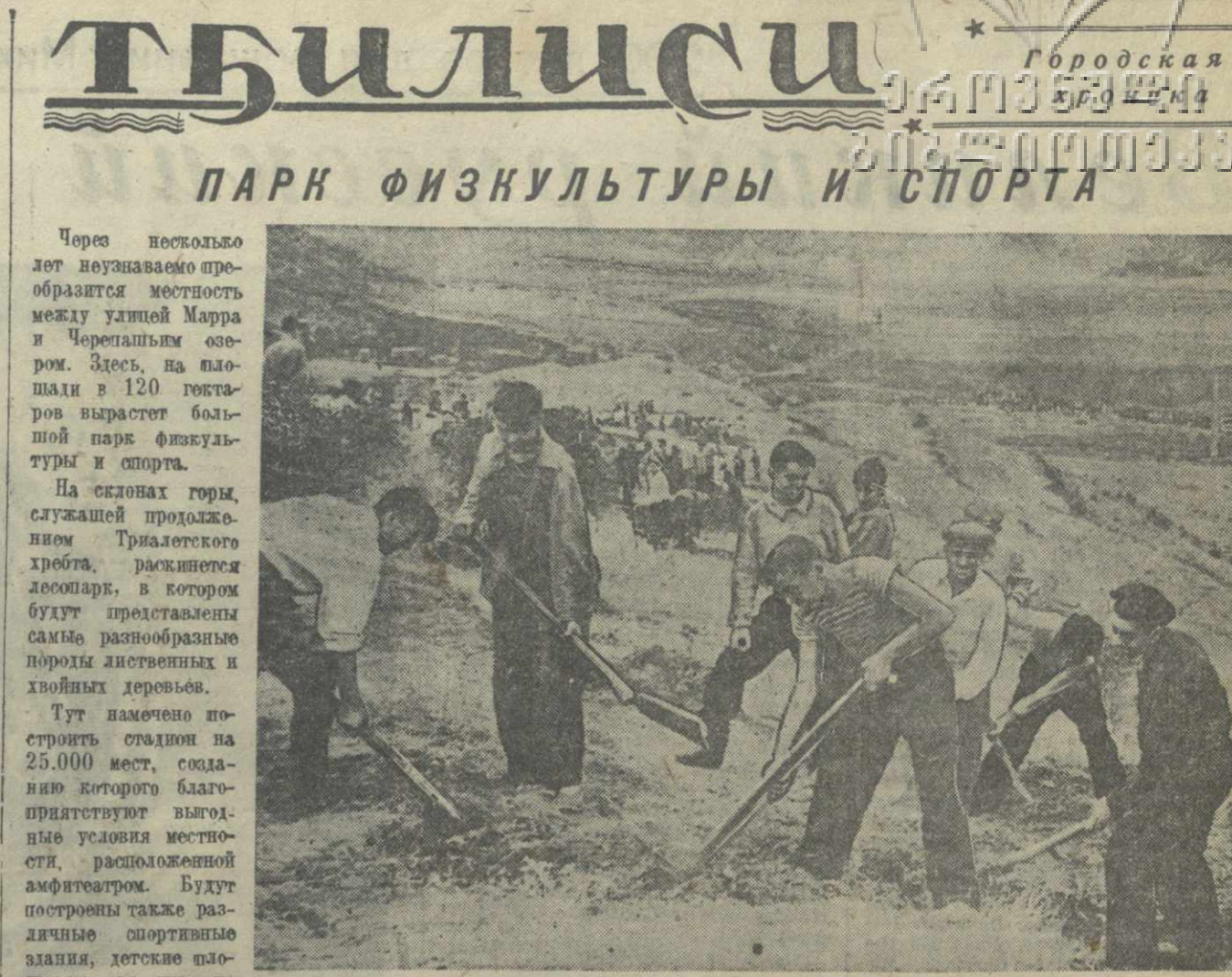
Труженицы Тбилиси на строительстве парка физкультуры.