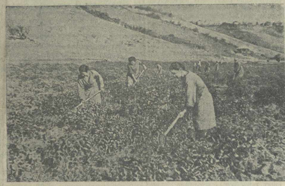
Перекопка почвы на чайных плантациях колхоза имени Махарадзе Гульришского района.

В нынешнем году звено соревнуется за еще больший урожай. Быстро ведутся предпосевные работы на участке звена.