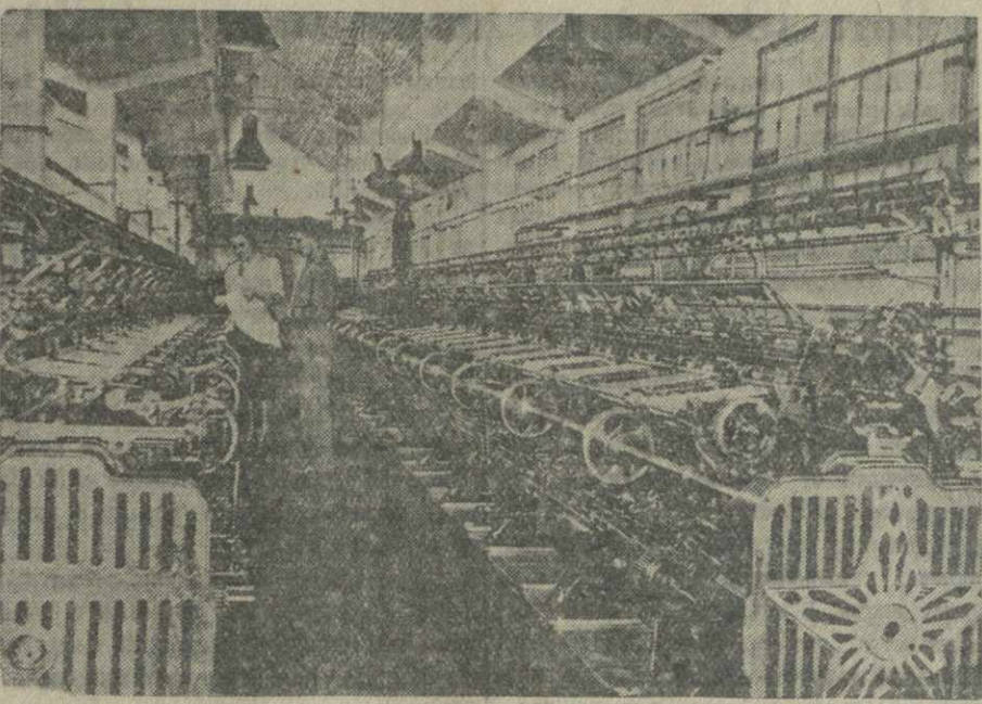
Новая чулочная фабрика Тбилисского трикотажно-пряdnльного комбината. На снимке: в коттонном цехе новой фабрики.