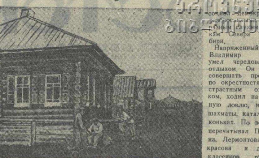
Дом в селе Шушенском, где жил В. И. Ленин в ссылке.

Ленину удалось, несмотря на все препятствия, связаться с zahraniчной группой «Освобождение труда», центрами революционной жизни в России, получать не только легальную, но и нелегальную литературу. Он пишет статьи и брошюры для легальных и нелегальных изданий. Перед Лениным