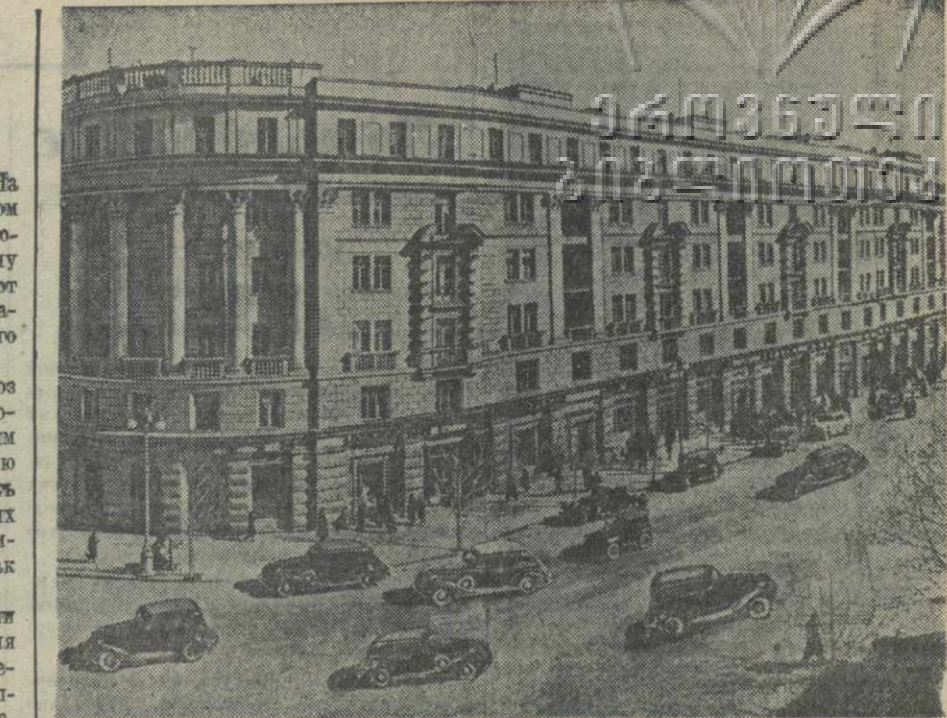
Тбилиси. Улица Коминтерна.

Отвечая Остину, А. А. Громыко отметил, что во время дебатов Остин стремился доказать, будто программа Союзных Штатов будет служить интересам греческого народа. Громыко заявил, что тем самым между польской, заявленной Союзными Штатами, и предложением Советского Союза нет никакого разрыва. Все же предложение Советского Союза не приемлемо для делегации Союзных Штатов. Привея замечания Остина о косвенном намерении Советского Союза, Громыко спросил, сколько косвенных намерений содержится в беззастенчивых заявлениях представителей Союзных Штатов, не скрывавших целей, для которых будет использоваться всякая помощь? Громыко спросил, сколько косвенных намерений содержится в заявлениях представителей Союзных Штатов, не скрывавших целей, для которых будет использоваться всякая помощь? Громыко спросил, сколько косвенных намерений содержится в заявлениях представителей Союзных Штатов, не скрывавших целей, для которых будет использоваться всякая помощь?