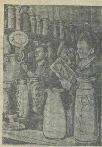
При Батумском заводе стройматериалов создан цех по выпуску искусственных баз, которые украшают живописно и барельефами. За короткое время цех выпустил уже более 1.000 таких баз. На снимке: отделека ваз в цехе.