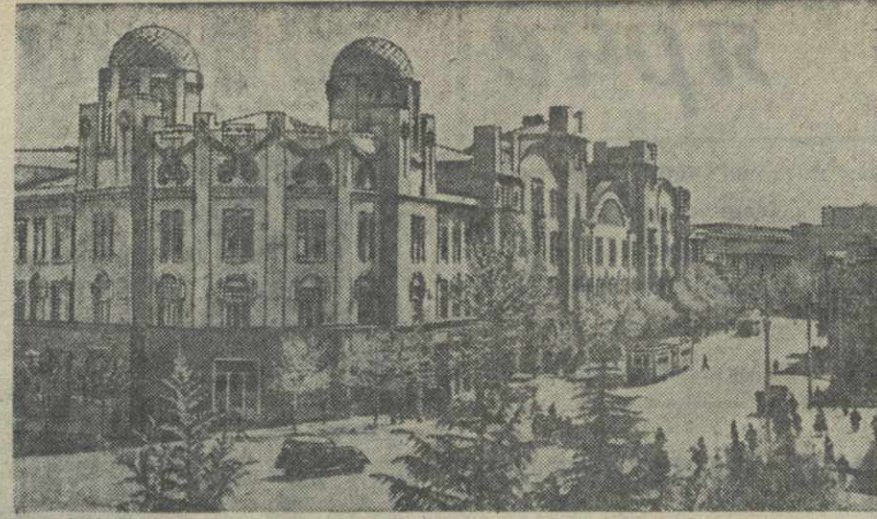
Тбилиси, Улица Ленина.

Верховный кассационный суд Италии, рассматривая жалобу наследника бывшего министра иностранных дел при Муссолини Чиамо, отменил решение трибунала о полной конфискации имущества Чиамо на том основании, что якобы нет доказательств ответственности Чиамо за заключение «стального пакта» с Германией, а также за объявление войны Греции. (ТАСС.)