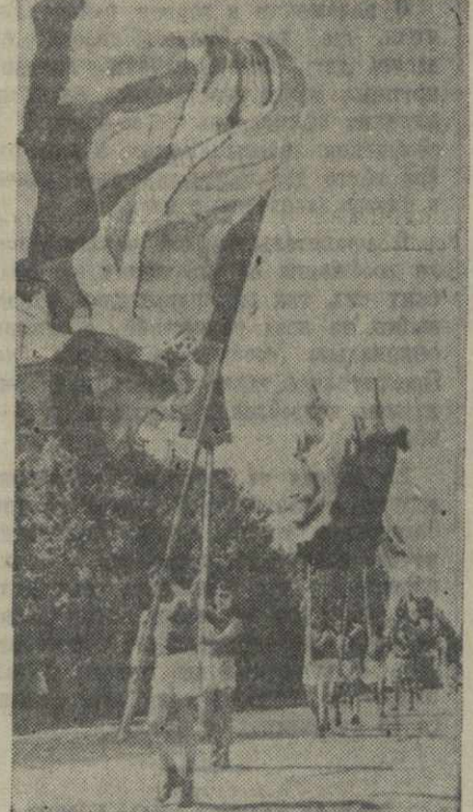
Знаменосцы Института физкультуры на площади им. Л. П. Берия.

Ярким было оформление многочисленных школ и высших учебных заведений Тбилиси — Государственного университета имени Сталина, Института инженеров транспорта имени Ленина, Политехнического института имени Кирова, Сельскохозяйственного института имени Берия и других. Школьная и студенческая молодежь, физкультурники бы-