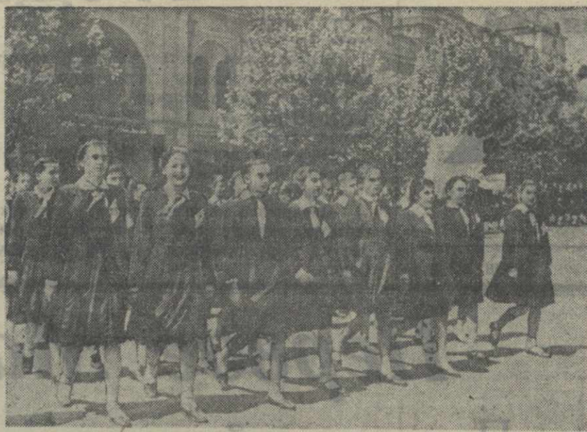
Учащиеся 25-й Тбилисской женской средней школы на первомайской демонстрации.

В этот праздничный первомайский день в демонстрации приняло участие до миллиона трудящихся г. Москвы. (ТАСС.)