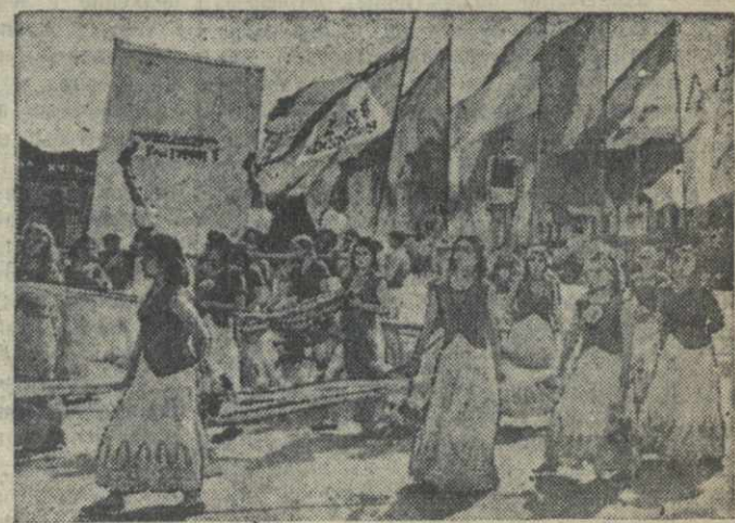
Первомайский парад и демонстрация в Тбилиси. На снимках: слева — участники грузинского ансамбля песни и пляски; в центре — танки и гвардейские минометы («катюши») на площади имени Берия; справа — выступление учащихся Физкультурного института перед трибуной.