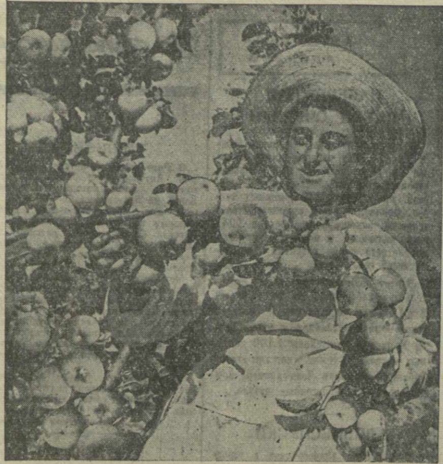
Совхоз Вариян Горького района. За сбором яблок.

Успешно выполнили свои предоктябрьские обязательства также колхоз имени Ленина селения Чанубани, имени 1 мая, имени II-свой дивизии и «Красный Октябрь».