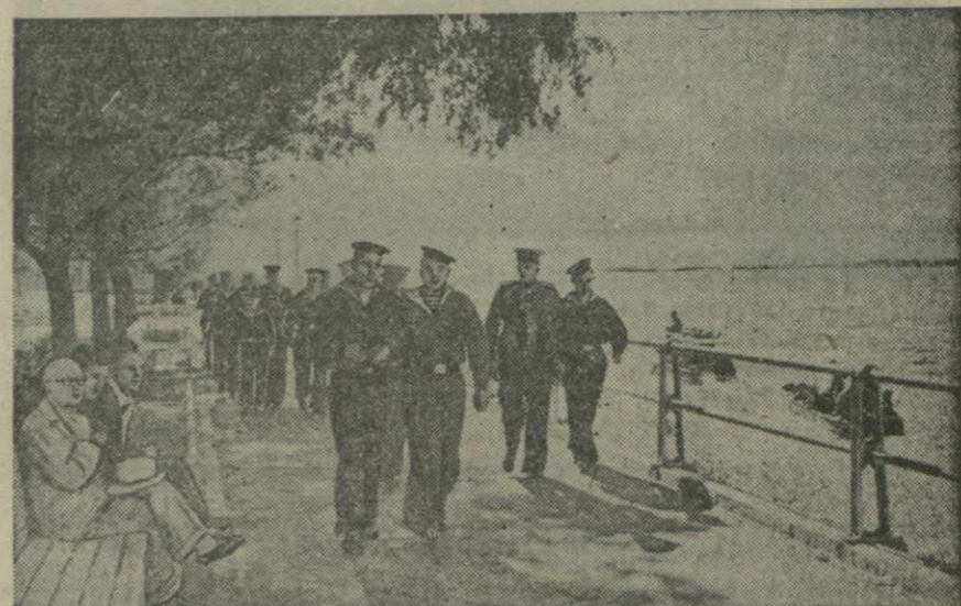
На набережной реки Сунгари в Харбине.

Предприятия текстильной, химической, металлургической и местной промышленности должны помочь мебельной промышленности выпускать более красивые обивочно-декоративных тканей, лаков, красок, пружин, зеркала, специальных стекол и фурнитуры. Это даст возможность изготовлять более прочную и изящную мебель. (ТАСС).