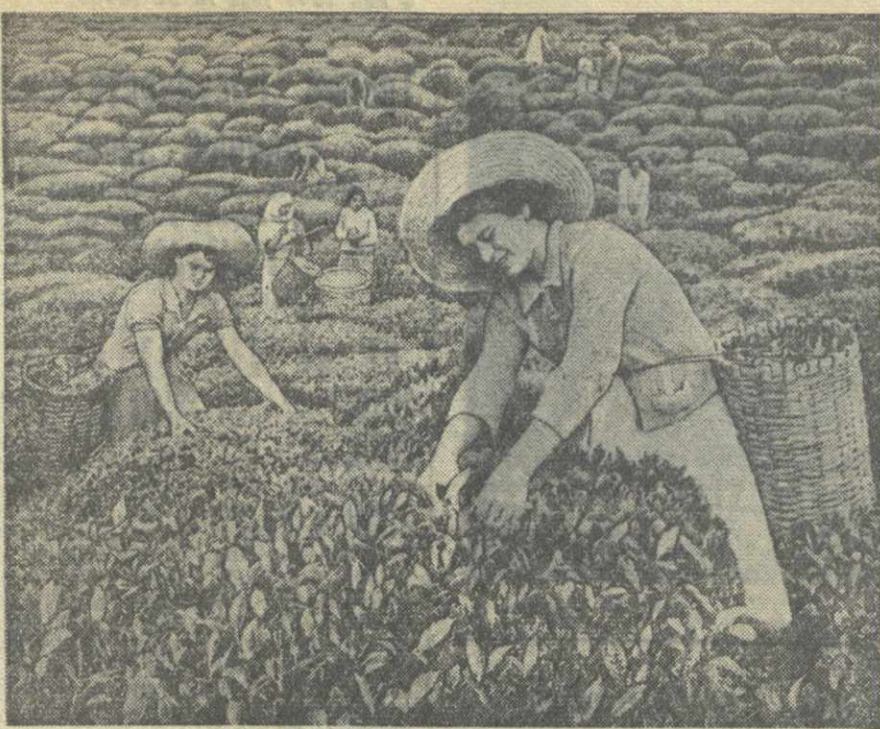
Сбор чайного листа в Чаквинском совхозе.