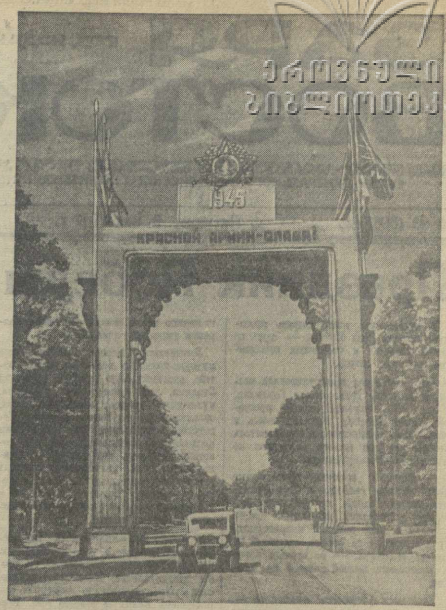
Арка Победы у в'езда в Берлин, на Франкфуртер-аллее.

Сессия Тбилисского городского Совета единогласно утвердила план восстановления и развития городского хозяйства Тбилиси на 1947 год, после чего рассмотрела организационные вопросы.