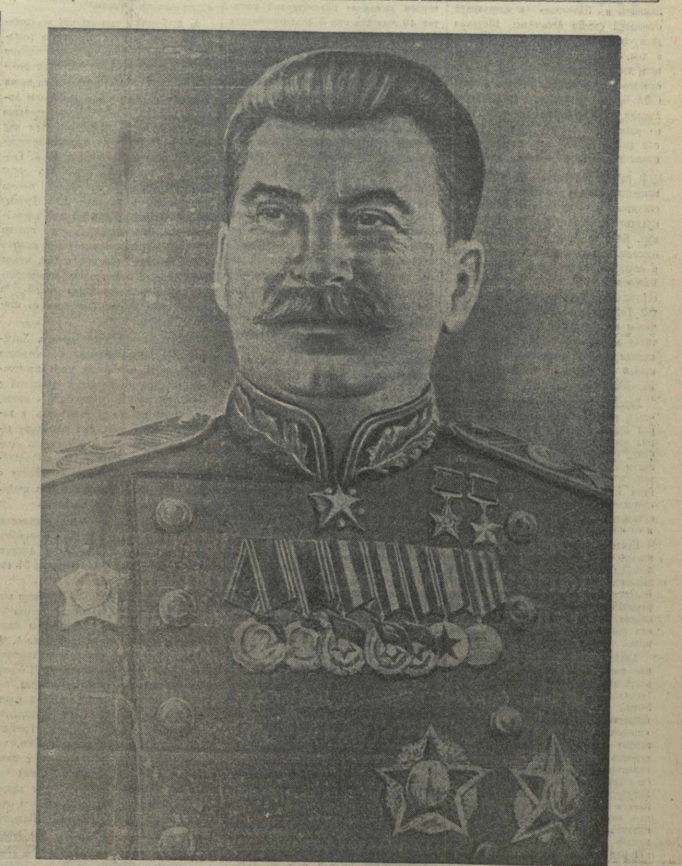
Генералиссимус Советского Союза И. В. СТАЛИН.

Май пришел к нам, — и просторы вновь одались пыльным цветом, Сердце радостью наполнил И согрел волшебным светом!