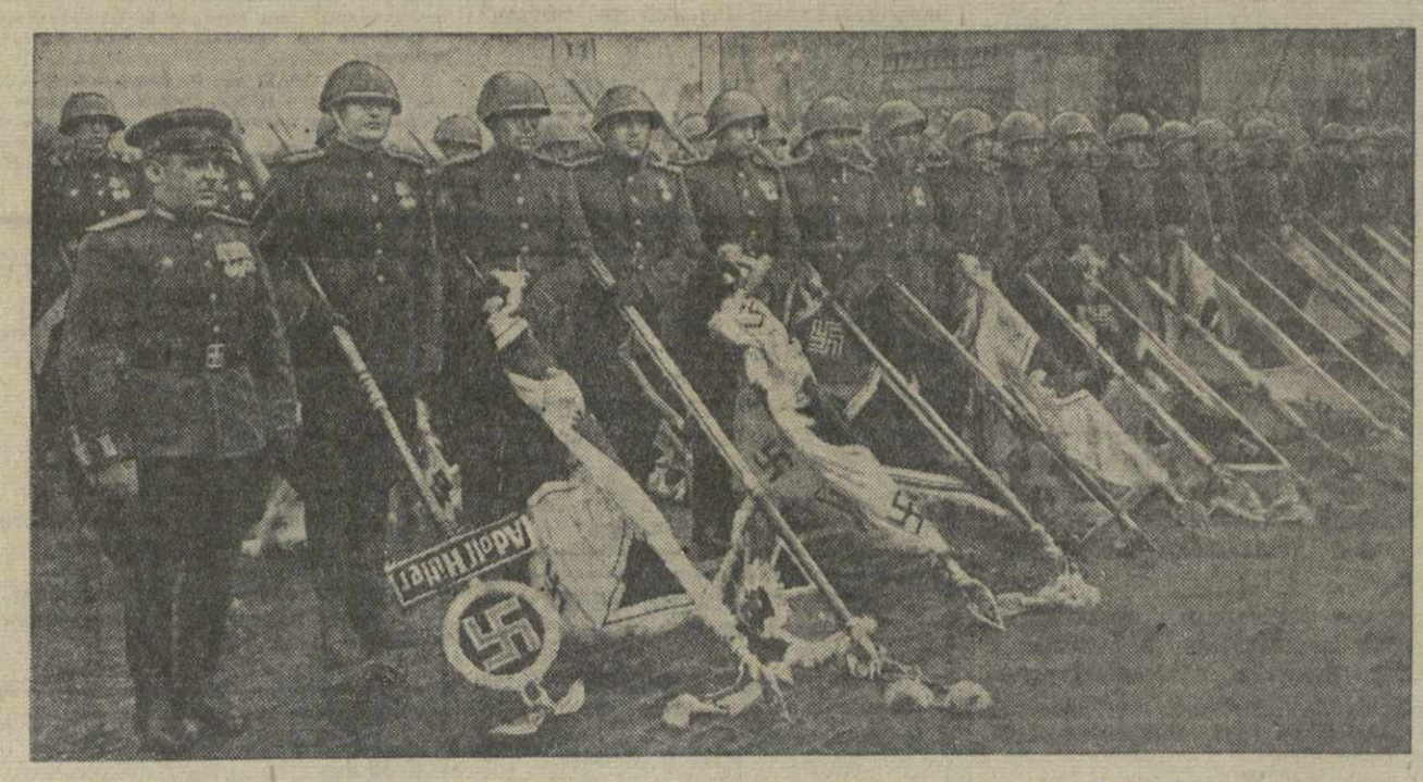
Советские войска с захваченными у немецких войск знаменами на параде Победы на Красной площади в Москве 24 июня 1945 г.