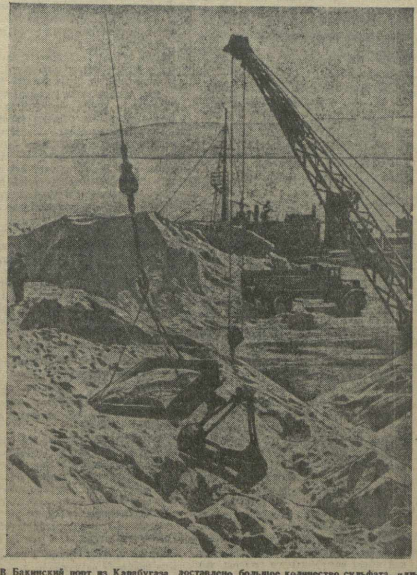
В Бакинском порту на Карабугаза доставлено большое количество сульфата, идущее для удобрения колхозных полей Азербайджана, Грузии и Армении. На снимке: на Бакинском шире. Погрузка сульфата в вагоны и на автомашины.

Радио добавляет, что английская военная администрация в Берлине отменила выданные местными английскими властями разрешение на въезд.