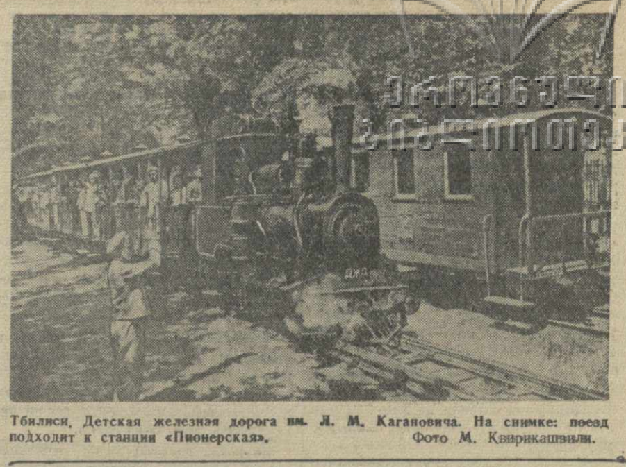
Тбилиси, Дегская железная дорога им. Л. М. Кагановича. На снимке: поезд подходит к станции «Пионерская».

18 мая в 11 ч. 30 м. утра и в 1 ч. дня СКАЗКА О ХРАБРОМ КРОЛИКЕ в 3 часа дня. МЕДВЕДЬ И ДЕВОЧКА.