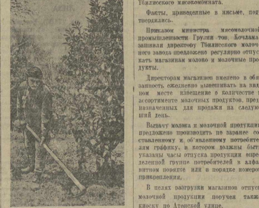
Мотыжение на цитрусовом плантации колхоза им. Чарквиани селения Кохтала Магарадзевского района.

В нынешнем году наш колхоз должен по плану сдать государству 93.000 килограммов зеленого чайного листа. Но колхозники обещали собрать не менее 100.000 килограммов. Своевременно проведены все работы на плантациях. Кусты выравняли, окрестили и быстро вегетируют. Положанию последних дней несколько задержало подход листа. Сейчас мы ведем лишь выборочный сбор. Массовый сбор начнем не сегодня-завтра. Для того, чтобы во-время собрать последний лист, не дать ему орубеть, мы закрепили за каждой боршпией отдельный участок. Такая организация