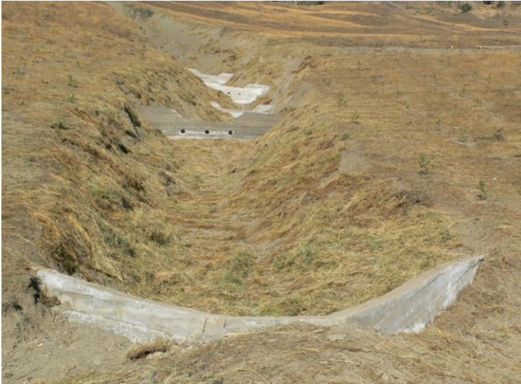
ა ) ხედი ქვევიდან ზევით