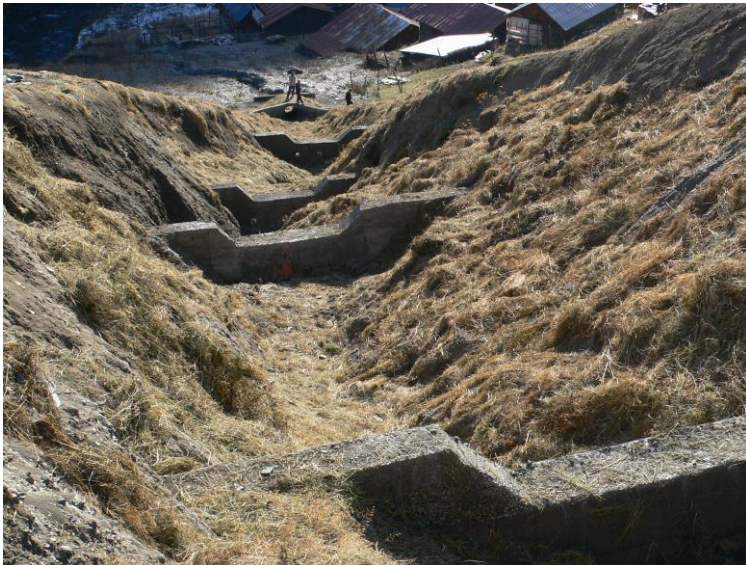
სურ. 2. ეროზიის საწინააღმდეგო ბეტონის ბარაჟები (ხედი ზევიდან ქვევით)

თითოეული კაშხალი გაანგარიშდა ამ შემთხვევისათ-