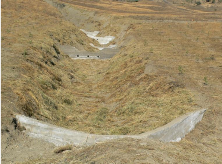
სურ. 1. ეროზიის საწინააღმდეგო ბეტონის ბარაჟები (ხედი ქვევიდან ზევით)