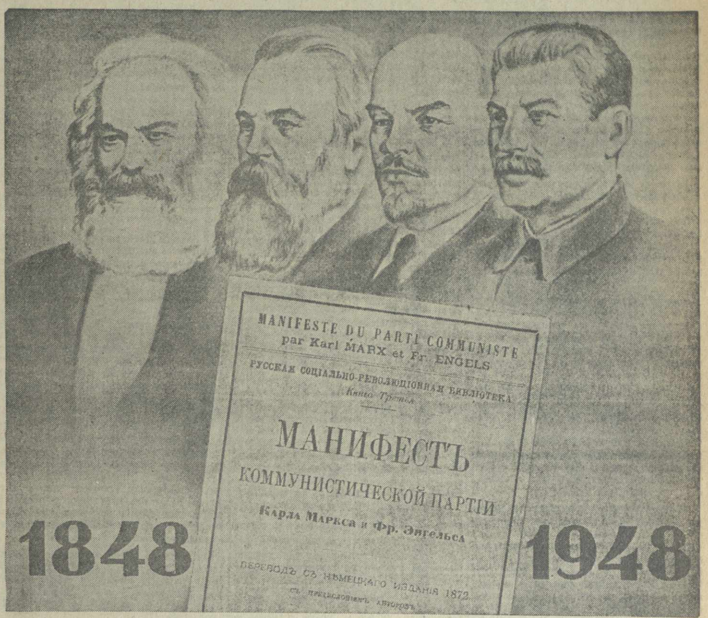
Рис. И. Гурро.

Республиканское совещание передовиков сельского хозяйства открывает тов. Д. С. Коротченко. Под бурные, долго не смолкающие аплодисменты в почетный президиум совещания избирается Политбюро ЦК ВКП(б), почетным председателем совещания — товарищ И. В. Сталин. С докладом „Об итогах 1947 сельскохозяйственного года и задачах по восстановлению и развитию сельского хозяйства Украины на 1948 год“ выступил министр сельского хозяйства Украинской ССР Г. П. Бутенко.