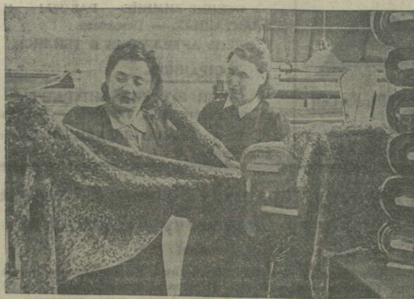
Восстановленная и пушечная рижская шелкоткацкая фабрика «Ригас-Аудумс», выпускает высочайшего качества шелковые ткани красивых расцветок. На снимке: проверка качества готовых тканей.

Тридцать пять лет назад, 20 ноября 1910 года, умер Лев Николаевич Толстой — гениальный русский писатель, художественное творчество которого подняло русскую литературу на недостижимую высоту, создало ей величайшую славу.