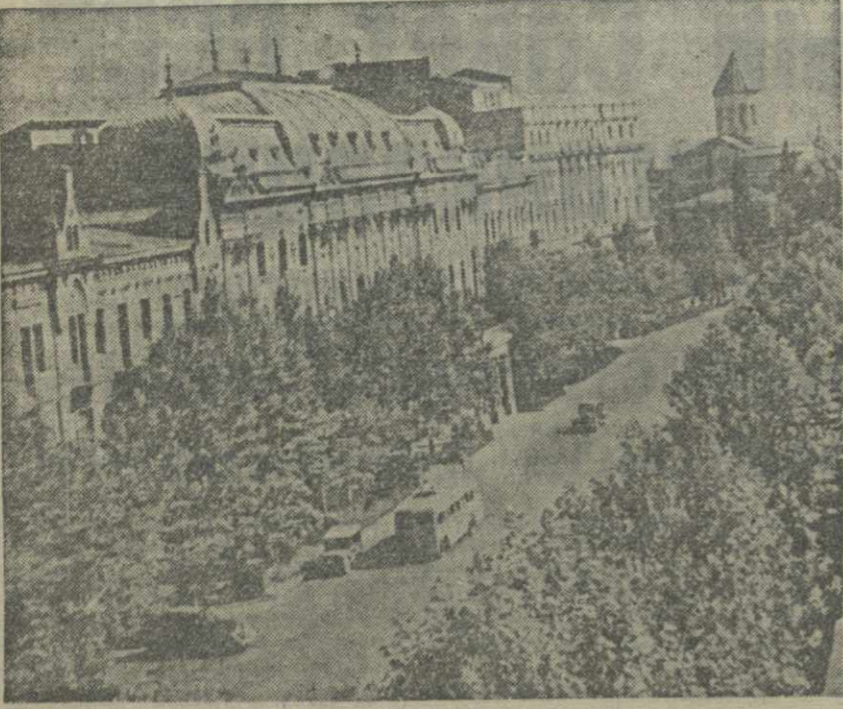
Тбилиси. Проспект имени Руставели.