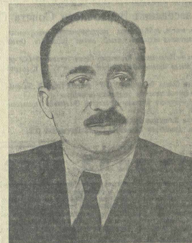
Р. А. Квирквелия, министр финансов Грузинской ССР.

Руководители министерств и предприятий должны немедленно устранить отмеченные недостатки, усилить себестоимость продукции, улучшить ее качество и увеличить накопления.