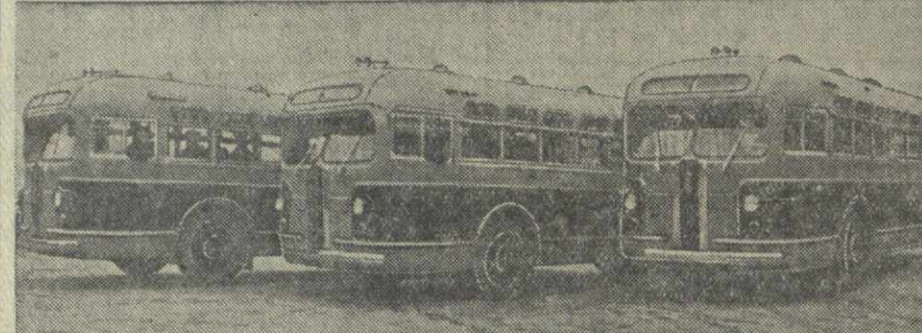
Тбилисская пассажирская автотранспортная контора получила из Москвы 3 новых автобуса «ЗИС-154».