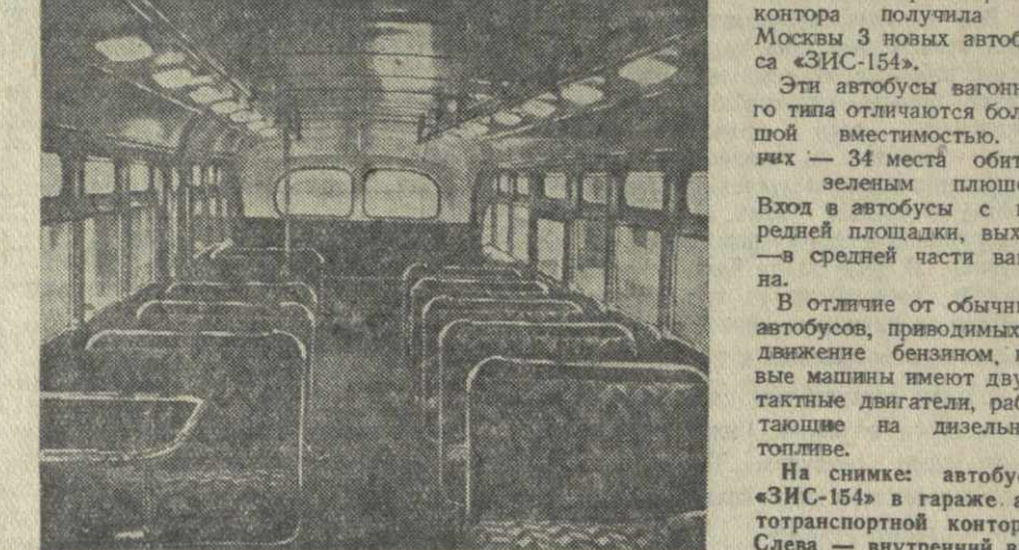
На снимке: автобусы «ЗИС-154» в гараже автотранспортной конторы. Слева — внутренний вид нового автобуса.