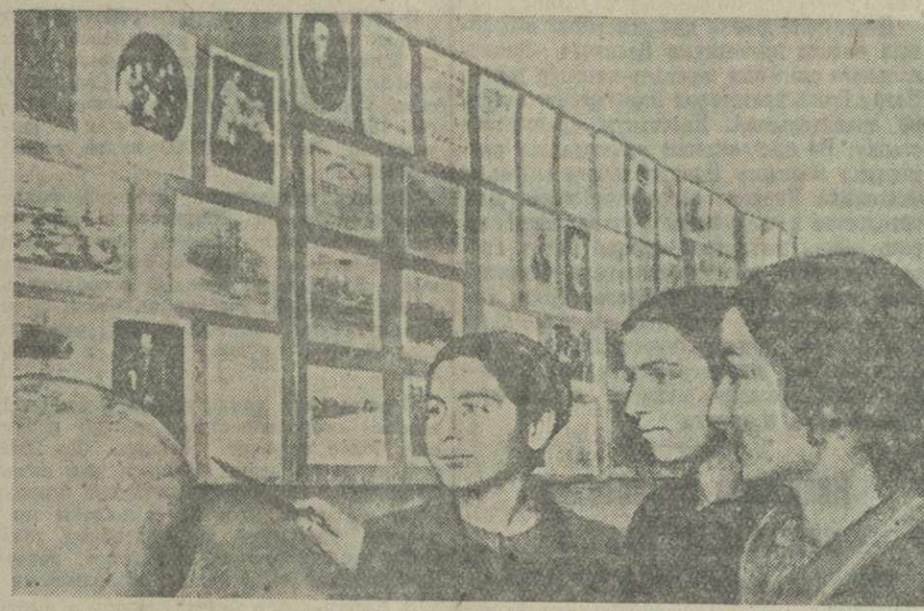
Недавно в Самтредиа в хорошем светлом помещении районный отдел культпросветработы открыл детскую библиотеку. При библиотеке открыта выставка материалов к биографии В. И. Ленина и И. В. Сталина.

В феврале работники библиотеки были дважды командированы в Гори для оказания на месте помощи общегородской и детской библиотекам.