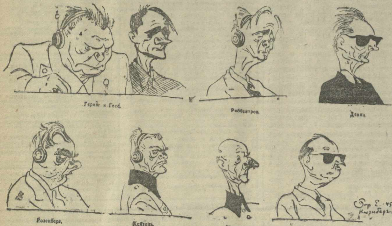
Геринг и Гесс